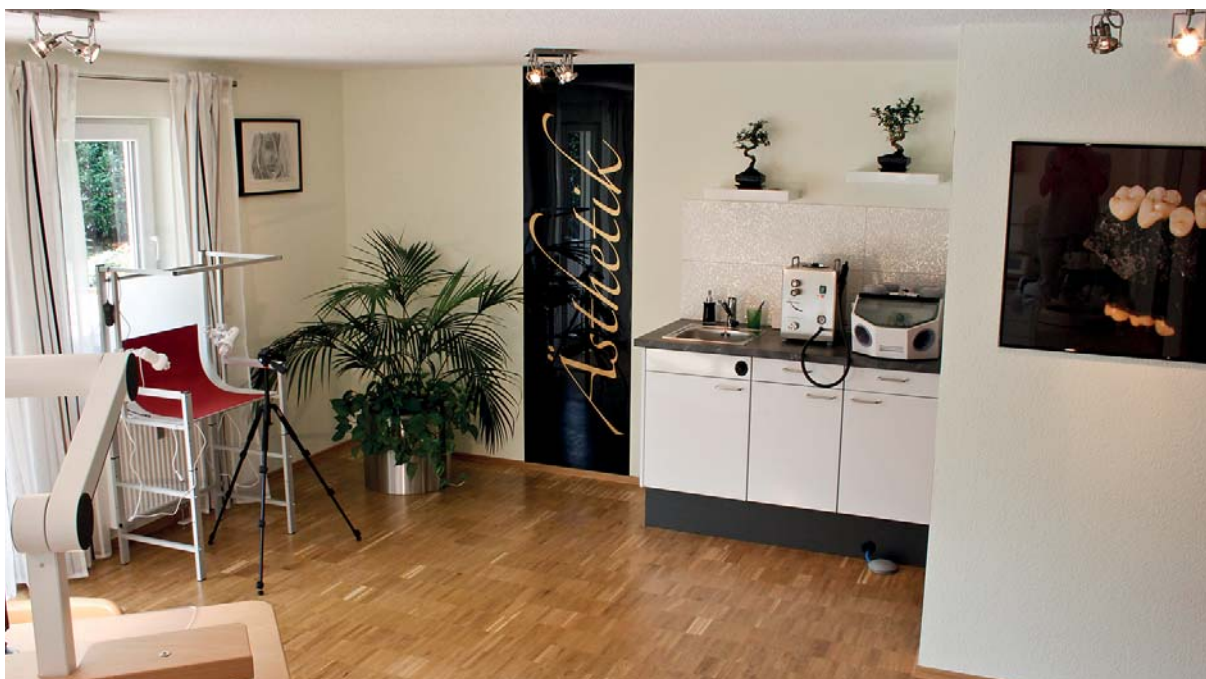
Abb. 1: Ansicht rechte Seite Arbeitsraum. An der Stelle des Fototisches kann jederzeit eine 3er-Arbeitsinsel erweitert werden. Alle notwendigen Anschlüsse sind unter dem Parkett vorhanden.

Arbeiten Zahntechnik und Behandler nicht eng zusammen, ist oft der Patient der Leidtragende. Um dies zu vermeiden, entscheiden sich immer mehr Behandler, ein eigenes Praxislabor in ihrer Zahnarztpraxis einzurichten. Der vorliegende Beitrag beschreibt alle Phasen dieses Einrichtungsprozesses, von der Planung bis zum fertigen Labor.